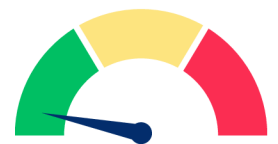
EASY, SUITABLE FOR ALL LEVELS