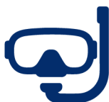
SUITABLE FOR SNORKELERS