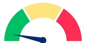
EASY, SUITABLE FOR ALL LEVELS