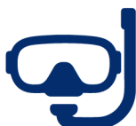
SUITABLE FOR SNORKELERS