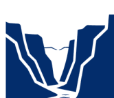
CAVES / CANYONS